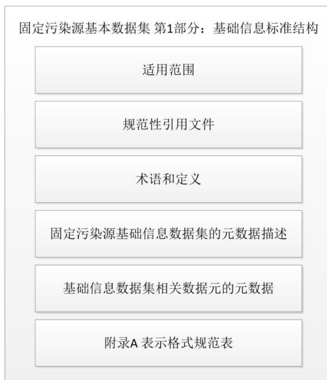
图 2 标准内容总体框架图

标准征求意见稿主要内容总体框架由适用范围、规范性引用文件、术语和定义、固定污染源基础信息数据集的元数据描述、基础信息数据集相关数据元的元数据，以及附录 A 表示格式规范表等六部分组成，如下图 2 所示。